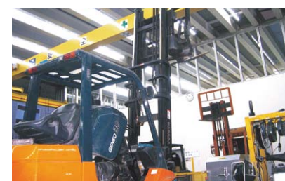
充実した設備の工場