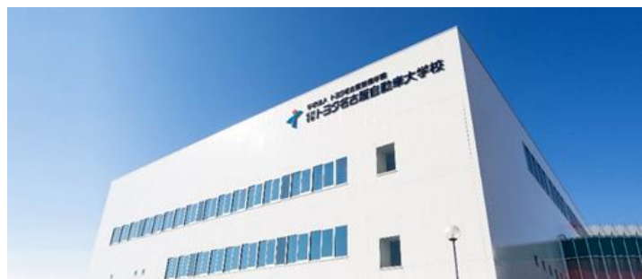
トヨタ名古屋自動車大学校