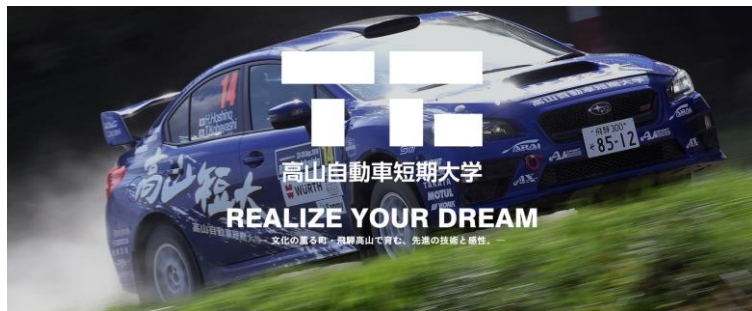
高山自動車短期大学