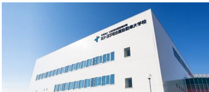
トヨタ名古屋自動車大学校